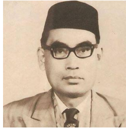
Dr. Burhanuddin al-Helmy